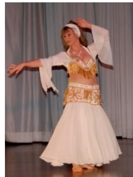
Workshop für orientalischen Tanz mit Amira el Amar