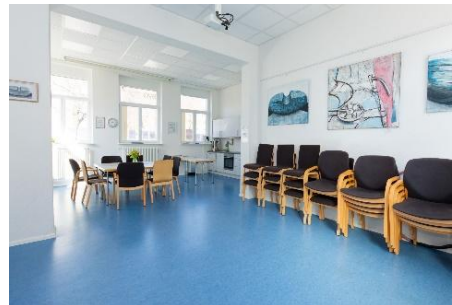
Quartierstreff Luckenbachweg, Freiburg-Haslach