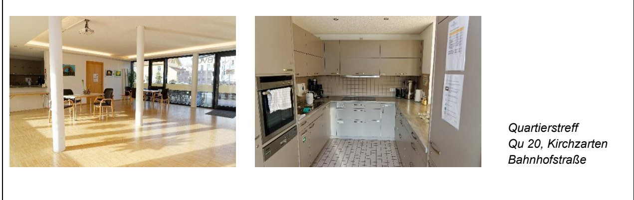
Quartierstreff Qu 20, Kirchzarten Bahnhofstraße

Ausstattung: barrierefrei, Beamer & Leinwand, Küche mit Kühl- schrank, Herd, Spülma- schine